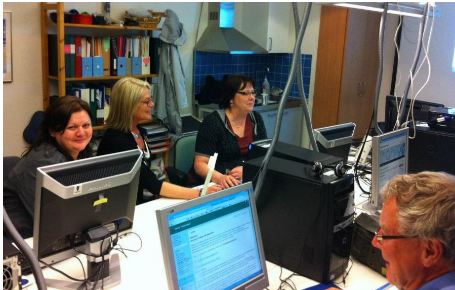
Studiecirkelledare som studiecirklar i Ronneby

Genomgående kan man säga att kommentarerna fokuserar på osäkerhet inför tekniken och behovet av mera utbildning.