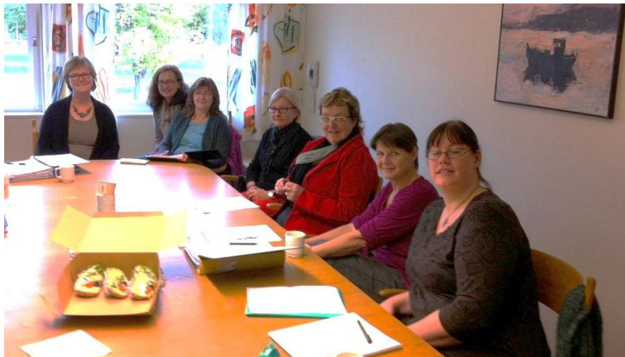
Möte med Digidel-gruppen i Mönsterås

Vi har nått ut till Digidels arbetsgrupper i Emmaboda, Nybro, Torsås, Mönsterås, Oskarshamn, Hultsfred, Vimmerby och Karlshamn. Deltagarna är från både bibliotek och studieförbund. Där har vi nått fyra av studieförbunden, SV, Sensus, ABF och NBV. Därutöver har vi träffat ett tiotal cirkelledare samt verksamhetschefer på lokal nivå.