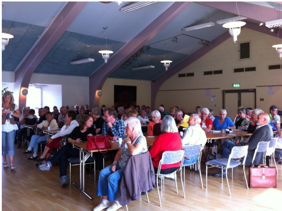
Cirkelledarträff med ABF Östra Småland i Hultsfred

Projektet har ju förlängts in i hösten 2012 där inriktningen har varit att genom uppsökande verksamhet med träffar med studieförbundspersonal och cirkelledare sprida resultatet av projektet.